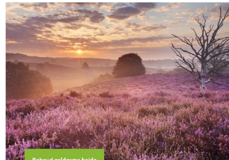
Behoud zeldzame heide

Inmiddels loop je al een tijdje in het bos van Staatsbosbeheer. Met hier een mooi punt om te genieten van het uitzicht over de glooiende heide. Ga je even op dit bankje zitten zonder te praten, dan hoor je gegarandeerd meerdere vogels! En kom je in de zomer dan zoemt de heide hier van de insecten.