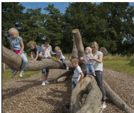
Cool Nature Hellendoorn